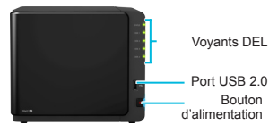
Voyants DEL Port USB 2.0 Bouton d'alimentation